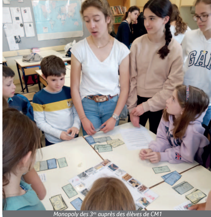
Monopoly des 3 es auprès des élèves de CM1

Nous remercions tous ceux qui ont rendu cette semaine possible.