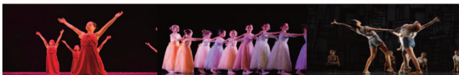
GALA 2023 - HDAS RECORDS