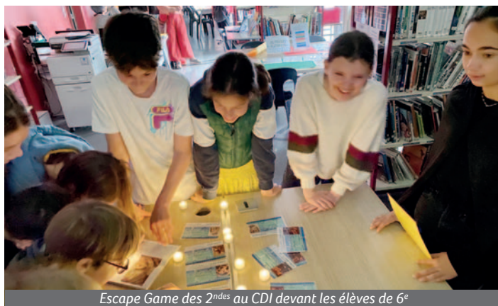
Escape Game des 2 nd es au CDI devant les élèves de 6 e