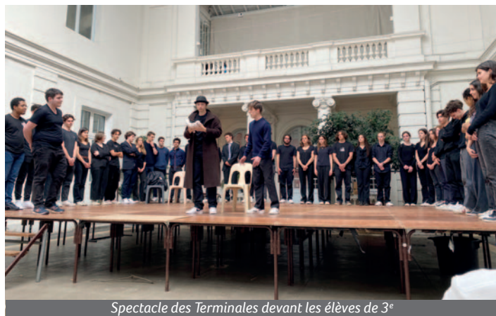
Spectacle des Terminales devant les élèves de 3 e