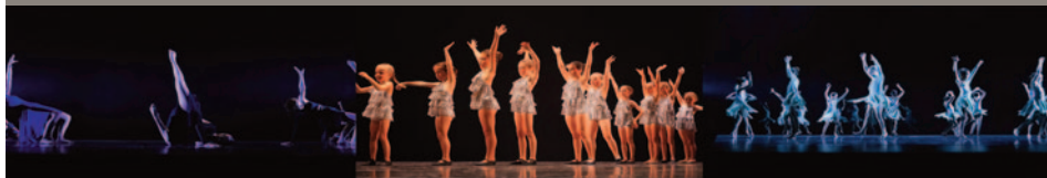
ECOLE DE DANSE - SAINTE-MARIE GRAND LEBRUN