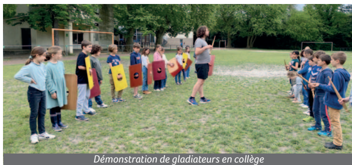
Démonstration de gladiateurs en collège