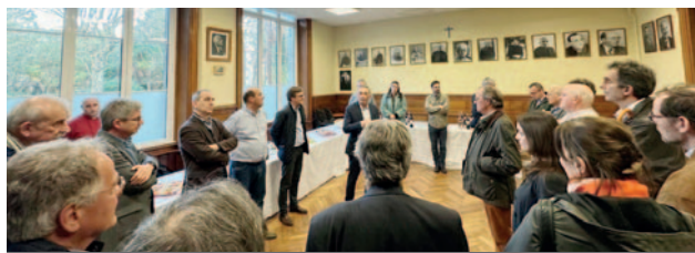
La salle François Mauriac : un cadre inspirant pour notre cocktail

Le tournoi sera suivi d'un cocktail dînatoire pour lequel nous vous attendrons nombreux !