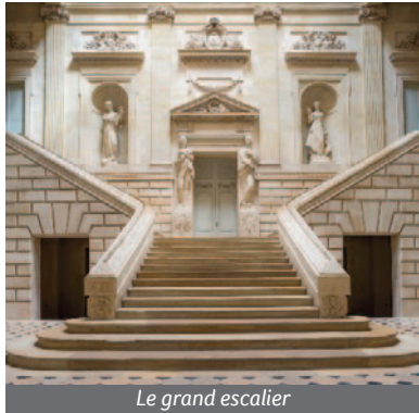
Le grand escalier

Le jeudi 4 mai nous avons fait une visite au Grand Théâtre de Bordeaux. Le guide nous a expliqué qu'il a été construit le 7 avril 1780 ; c'est l'architecte Victor Louis qui a fait les plans. Il est de style néo-classique. Sur la façade, nous pouvons voir 9 muses et 3 déesses : Euterpe, qui est la muse de la musique, Uranie, Calliope, Terpsichore, Melpomène, Thalie, Polymnie, Erato et Clio sont les 9 muses et Junon, Vénus, Minerve sont les 3 déesses.