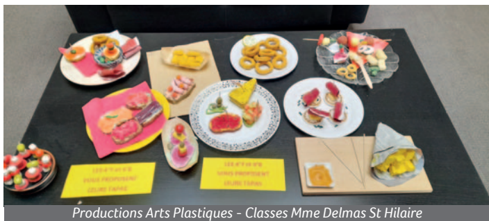
Productions Arts Plastiques - Classes Mme Delmas St Hilaire