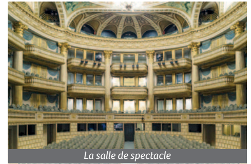
La salle de spectacle

En entrant dans le grand hall du théâtre, nous avons vu une statue de Victor Louis. Le guide nous a aussi expliqué que cette salle ne servait à rien, c'était juste une transition entre le bruit de l'extérieur et le calme intérieur du grand théâtre.