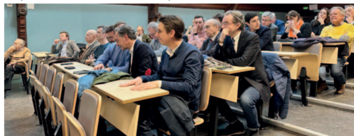
Présentation des nouveaux membres du bureau et de notre rapport moral dans le nouvel amphithéâtre Lalanne